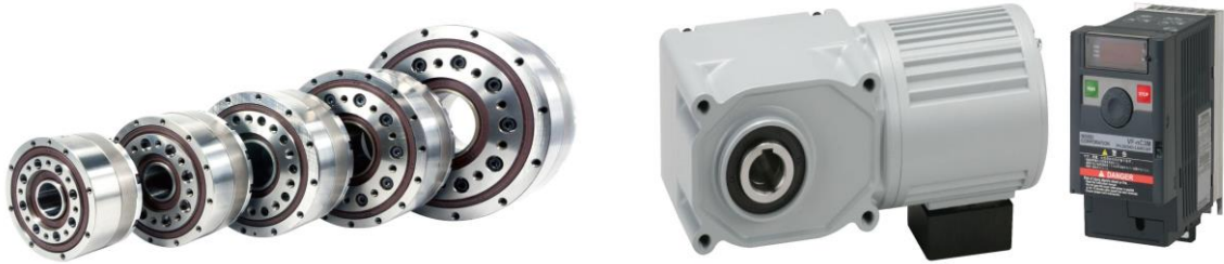
▲고강성 감속기(왼쪽)와 IPM기어모터.

이중 주력제품인 고강성 감속기는 기동과 정지를 반복하는 로봇이나 FA기기의 기능을 대폭 향상시킬 수 있다. 대구경 중공 타입으로 기기 설계 및 구성이 자유롭고 고토크, 제로 백래시 등이 특징이다. 고강성 감속기 제품 중 하나인 공작기계 터렛 구동 감속기는 고정밀, 충격, 진동에 강하며 감속비에 비해 사이즈가 작다.