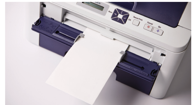
두꺼운 용지 또는 봉투 인쇄 가능