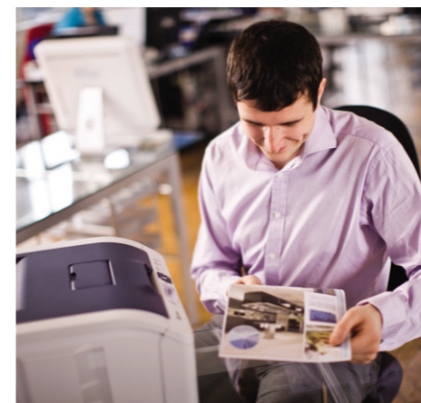
16ppm(A4)의 인쇄 속도로 컬러 문서 즉석 출력