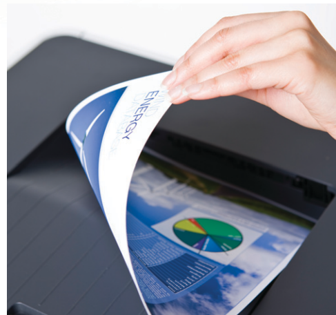
양면 인쇄는 용지 사용을 줄여줍니다.

HL-4150CDN의 혁신적이고 사용하기 쉬운 솔루션을 통해 업무 비용과 시간을 절약할 수 있습니다.