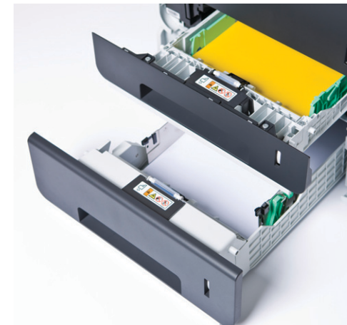
보다 편리한 용지 사용을 위한 보조 용지함 옵션