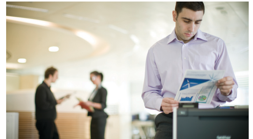
바쁜 사무실 환경에 이상적인 솔루션: 기존 네트워크를 통해 리소스를 공유할 수 있습니다.