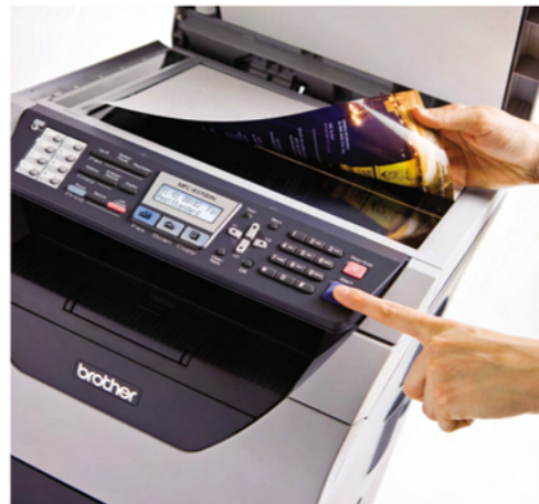
A4 컬러 문서 스캔

전문가 수준의 높은 품질과 낮은 유지비를 자랑하는 컴팩트형 흑백 레이저 복합기로 고속의 올인원 성능을 체험하세요!