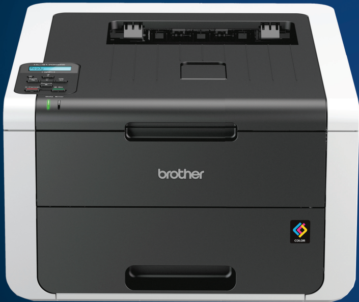
유무선 네트워크 지원 HL-3170CDW