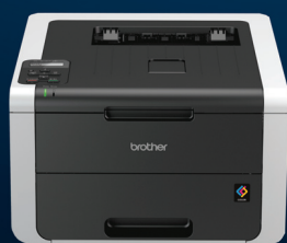
유선 네트워크 지원 HL-3150CDN