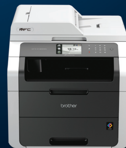
유선 네트워크 지원 MFC-9140CDN