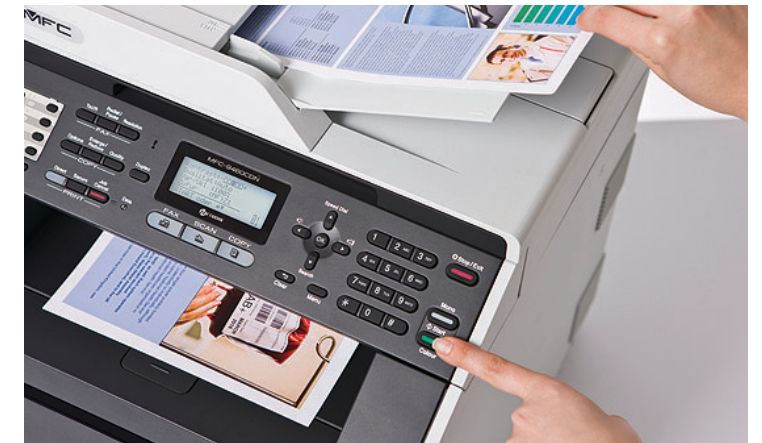
자동 문서 급지대(ADF)는 여러 페이지로 되어 있는 자료를 쉽고 빠르게 복사할 수 있도록 지원합니다.