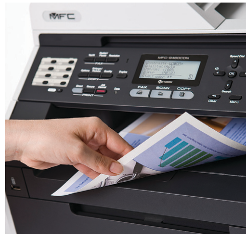
전문적인 비즈니스 문서를 위한 자동 양면 인쇄 기능

인쇄 비용은 낮추고 업무 생산성은 높여주는 다양하고 유용한 기능을 제공합니다.