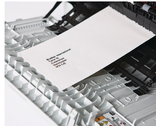
다목적 용지함을 사용하면 봉투나 보다 두꺼운 용지에 인쇄할 수 있습니다.