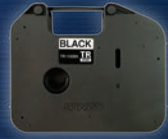
잉크 리본(TR-100BK) 튜브 인쇄에 사용되는 100m 검정색 잉크 리본.