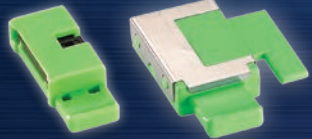
튜브 커터(PA-TC-001) 튜브를 원하는 길이로 절단합니다.