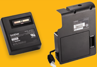
충전식 리튬-이온 배터리(PA-BT-4000Li) 및 배터리 베이스(PA-BB-003) 충전식 배터리를 사용하여 전원코드가 없는 환경에서도 튜브 프린터를 사용할 수 있습니다.