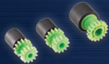
컨베이어스 롤러 (PA-RL-001, PA-RL-002 & PA-RL-003) 튜브가 장비를 매끄럽게 통과하여 이동하도록 해줍니다.