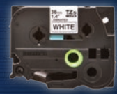
TZe 테이프 사무실과 산업 용도로 적합한 브라더의 TZe 표준 라미네이트 테이프는 물, 기름, 퇴색, 마모 화학약품 등에 대한 뛰어난 내구성을 자랑합니다.