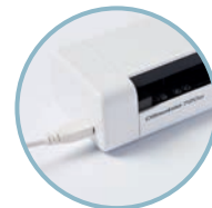
USB 전원 공급